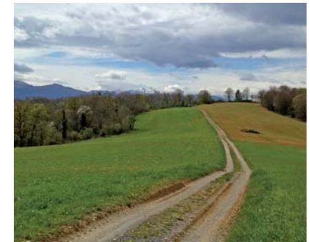
Le chemin entre bois et panorama