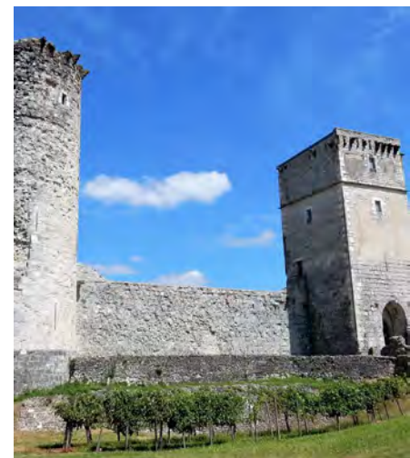
Château de Bellocq