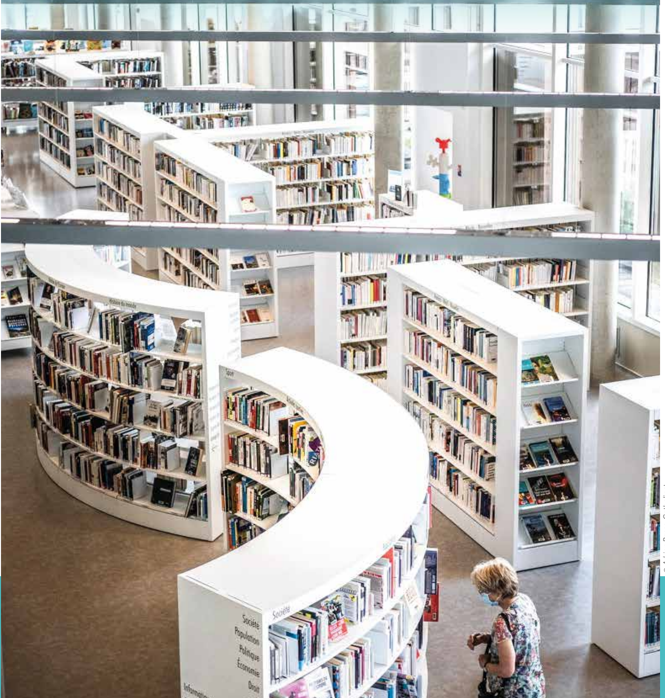
2016 : le MI[X], maison intercommunale des cultures et des sciences, sort de terre et ouvre les portes de toutes les cultures en plein Mournex.