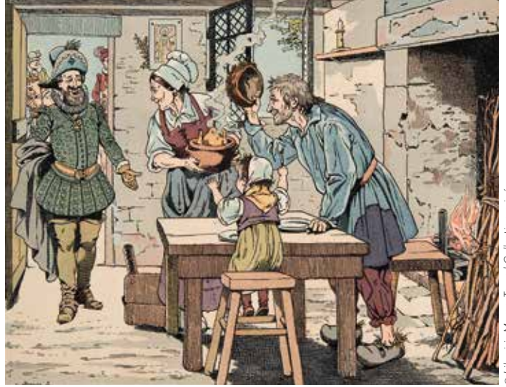
Illustration du livre « Le bon Roy Henri », 1894 par Jacques Marie Gaston Onfray de Bréville, dit Job

Tout cela et plus encore sur l'agenda de www.cc-lacqorthez.fr