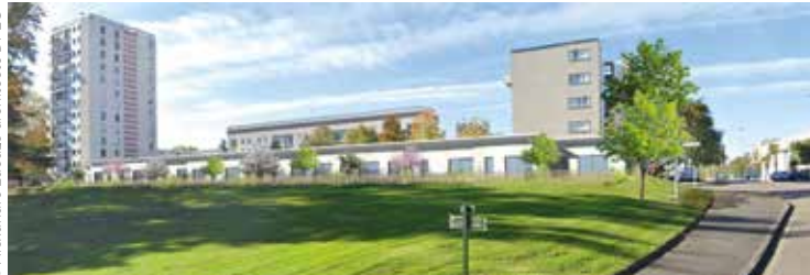
Travaux à venir, boulevard de la République « Les Chalets de Pombie ».