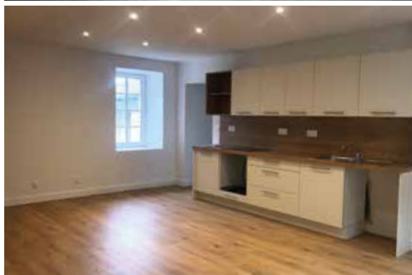
Un « avant-après » travaux en 2025, rue du Pont Vieux.

① Propriétaires occupants aux revenus modestes ou bailleurs louant un logement social conventionné. Rénovation énergétique, adaptation à la mobilité réduite ou réhabilitation complète d'un bâti très dégradé : jusqu'à 100 % du montant de vos travaux peuvent être subventionnés !