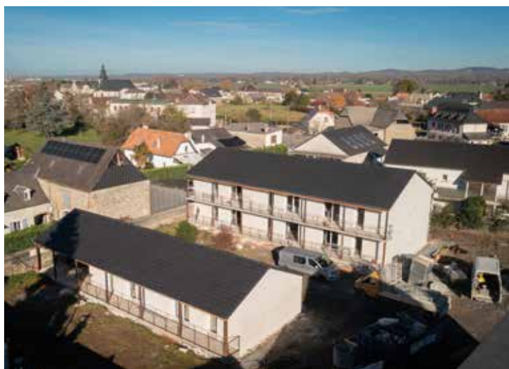
Travaux en cours, rue du Prat.