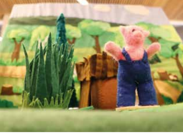
Un tapis-lecture pour raconter Les trois petits cochons , fait sur-mesure pour le pôle lecture par Olga, lectrice-habitante de Mourenx.