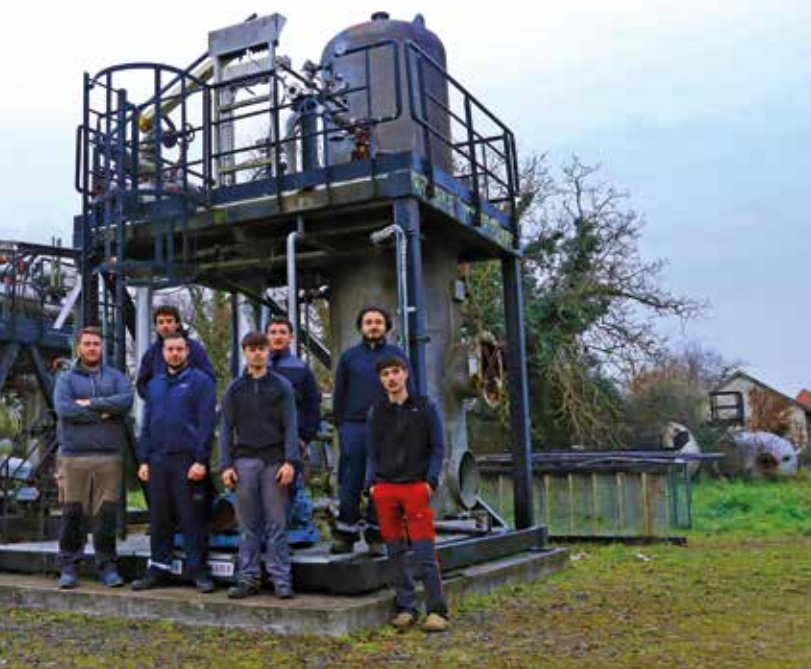
Les sept apprenants tuyauteurs de la première promotion du Pôle formation Adour à Lacq, devant le « skid » qui leur permet d'apprendre grandeur nature.

signer des contrats de professionnalisation avec les élèves de leur choix. »