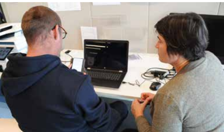
Une séance de 30 minutes d'accompagnement individuel à la cyberbase (gratuit sur rendez-vous).