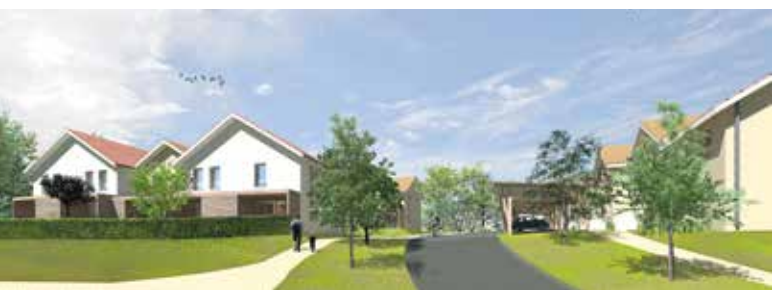
Travaux à venir, rue Matachot.

TRAVAUX DE JANVIER 2026 À 2027. Coût de l'opération : 5,3 millions €, soutenue à hauteur de 158 136 € par Lacq-Orthez.