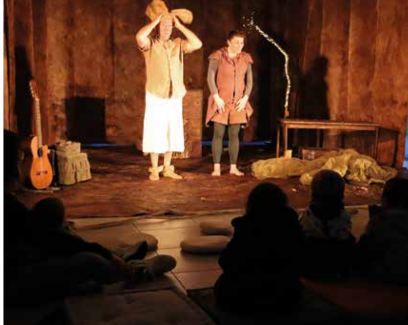
Spectacle Carton à Sault-de-Navaillès, par la compagnie Les voyageurs immobiles.

Située dans l'ancienne gare de la commune, la bibliothèque fonctionne un peu comme celle de Lucq-de-Béarn. Elle accueille en prime quatre animations par an, proposées par notre pôle lecture. « Ce sont toujours de très jolis spectacles. Sans le pôle lecture, nous ne pourrions pas proposer de tels événements. Mais il nous faut quand même être là pour préparer la salle, accueillir les artistes et le public.