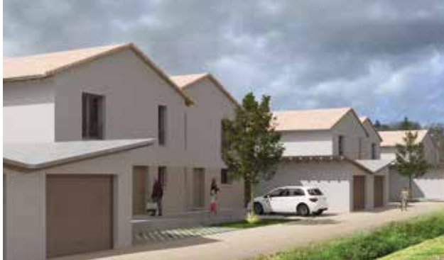
Travaux en cours, chemin de Saubagnac.