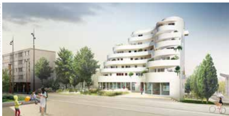
Travaux en cours, place des Pyrénées « Les Terrasses du Tourmalet ».