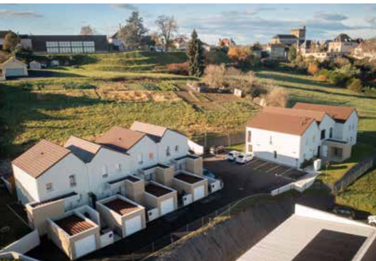
Projet terminé, rue des Écoles.

Créés par des organismes de logement social, communément appelés bailleurs sociaux, ces maisons ou appartements répondent à des besoins ciblés par notre programme local de l'habitat, qui a fixé la production de 595 logements sociaux sur la période 2024-2030. Tous sont pensés en concertation avec les communes, et situés en cœurs de bourgs.