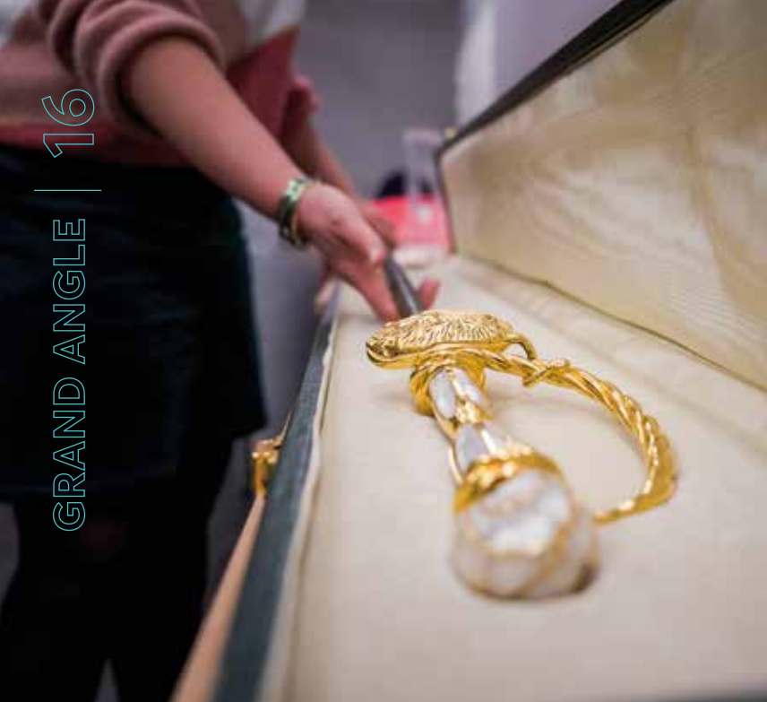
L'épée d'académicien de Jean-Louis Curtis

En présence de ces documents et objets précieux, nous touchons du doigt l'histoire locale, parfois étonnante et prestigieuse. À travers eux, une galerie de personnages se rappelle à nous, ainsi que tout un pan de la culture française.