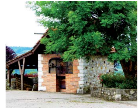
Le four à pain