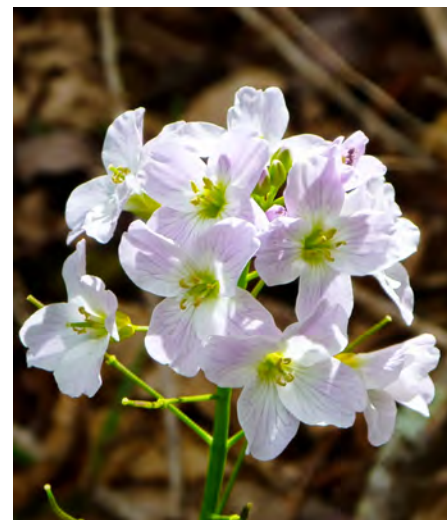
Cresson des prés