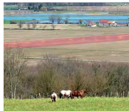
Les Barthes de Biron