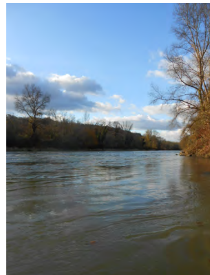
Berges du Gave, Salles-Mongiscard