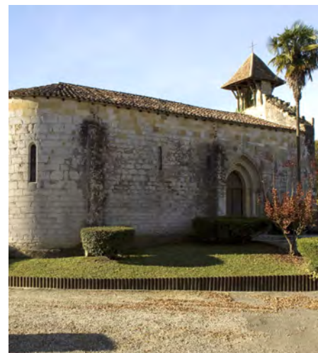
La chapelle de Caubin à Arthez-de-Béarn