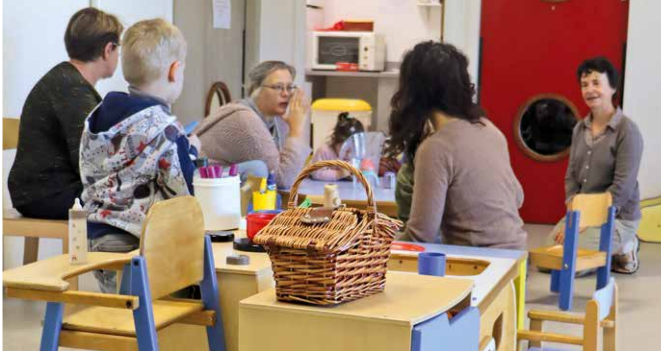
Moment d'échange autour d'une petite collation au lieu d'accueil enfants-parents Les 1000 pattes.