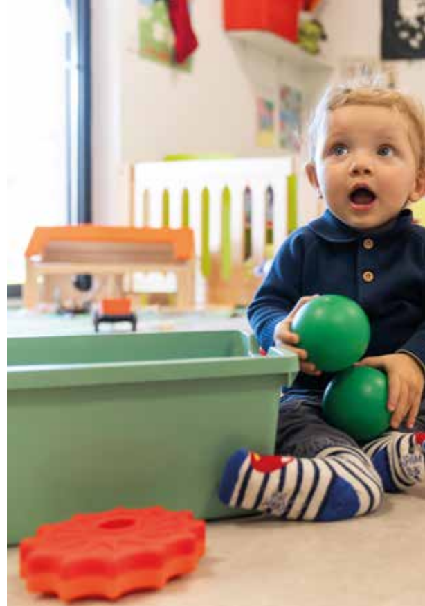
À la maison intercommunale de la petite enfance à Orthez, qui regroupe une crèche, un relais petite enfance et un lieu d'accueil enfants-parents.