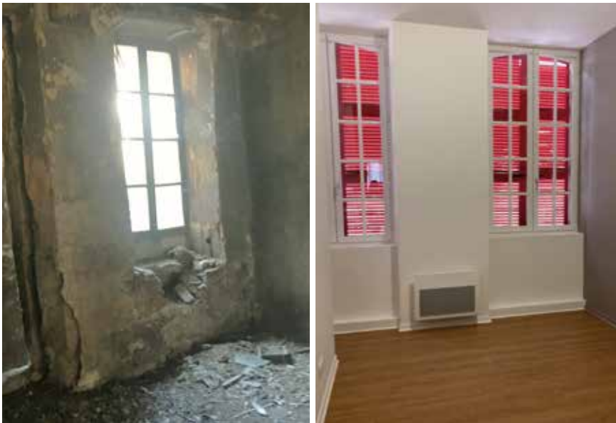
Spectaculaire "avant-après" d'un appartement de la rue de l'Horloge.