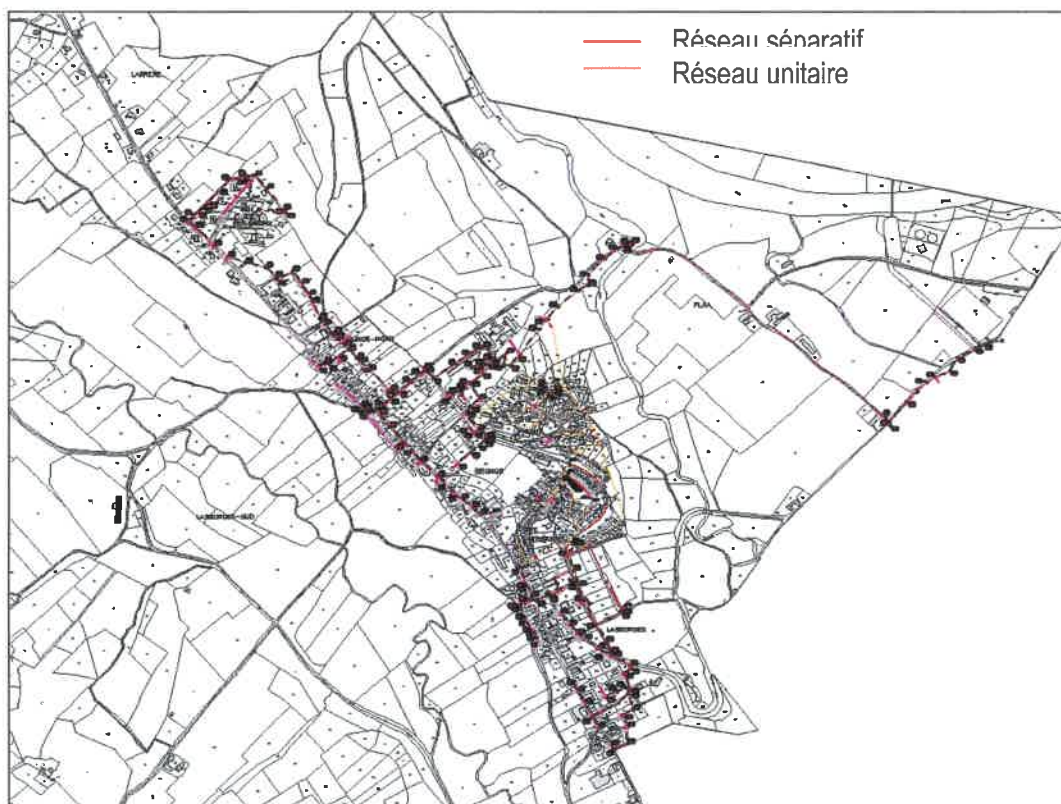
Réseau de collecte des eaux usées sur la commune de Lagor

Ce réseau collectif qui achemine les effluents vers la station d'Abidos est long et de configuration multiple. Il présente des parties unitaires et des parties séparatives et il collecte massivement des eaux claires parasites. A la suite d'une pluie significative, la période de ressuyage est longue. L'analyse des débits traités à la station met en évidence des surcharges hydrauliques. Des travaux de réhabilitation des réseaux sont engagés par le Syndicat Gave et Baïse pour réduire ces entrées d'eaux parasites.